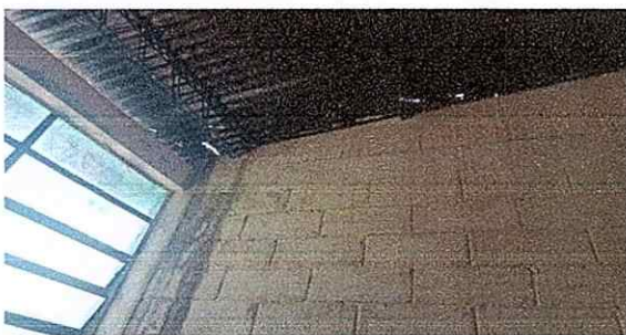
Foto 5: se observa deterioro de las laminas, como tambien humedad en las paredes.