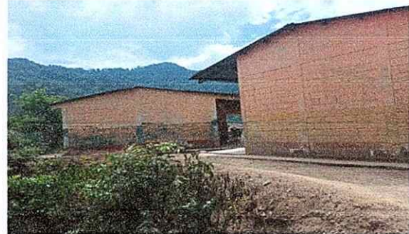
Foto 2: se observa el deterioro de las paredes, desprendimiento de pintura.