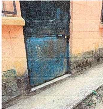
Foto1: se observa en la fotografía deterioro de la puerta de las aulas.